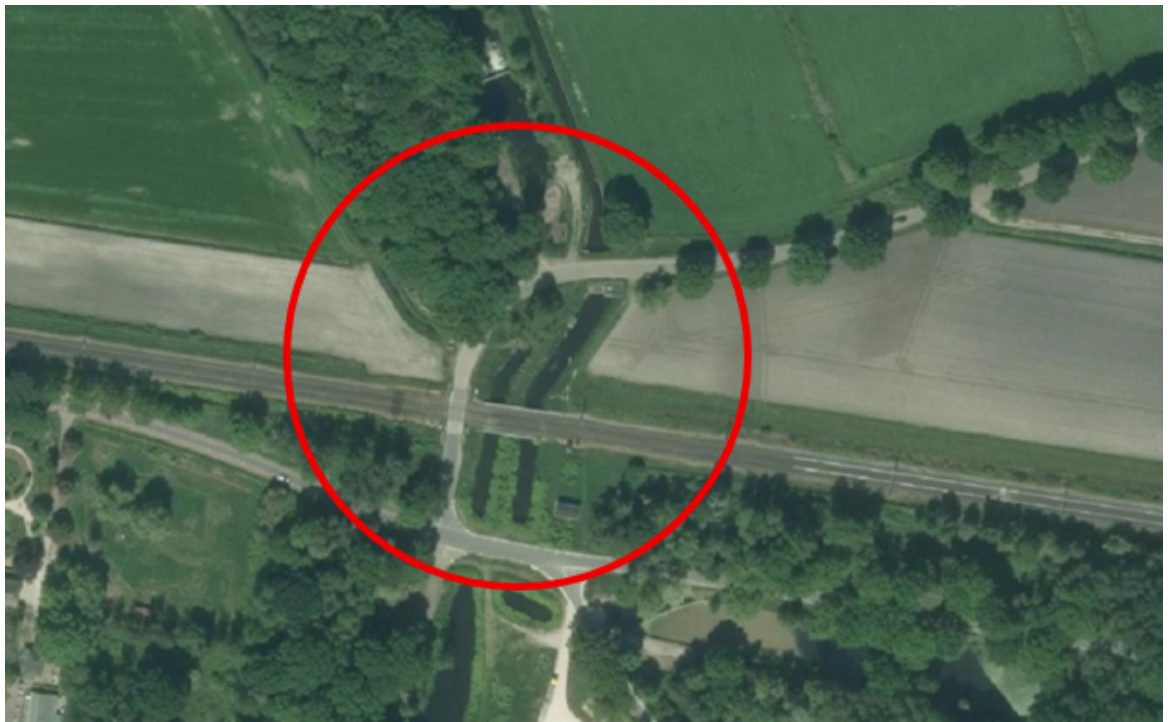
Figuur 2: lokale situatie Helenavaart/De Halte