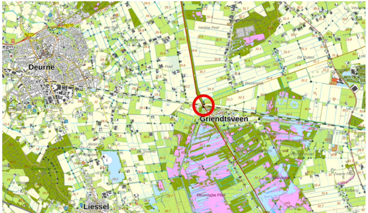
Figuur 1: Regionale ligging vuilvanger Griendtsveen