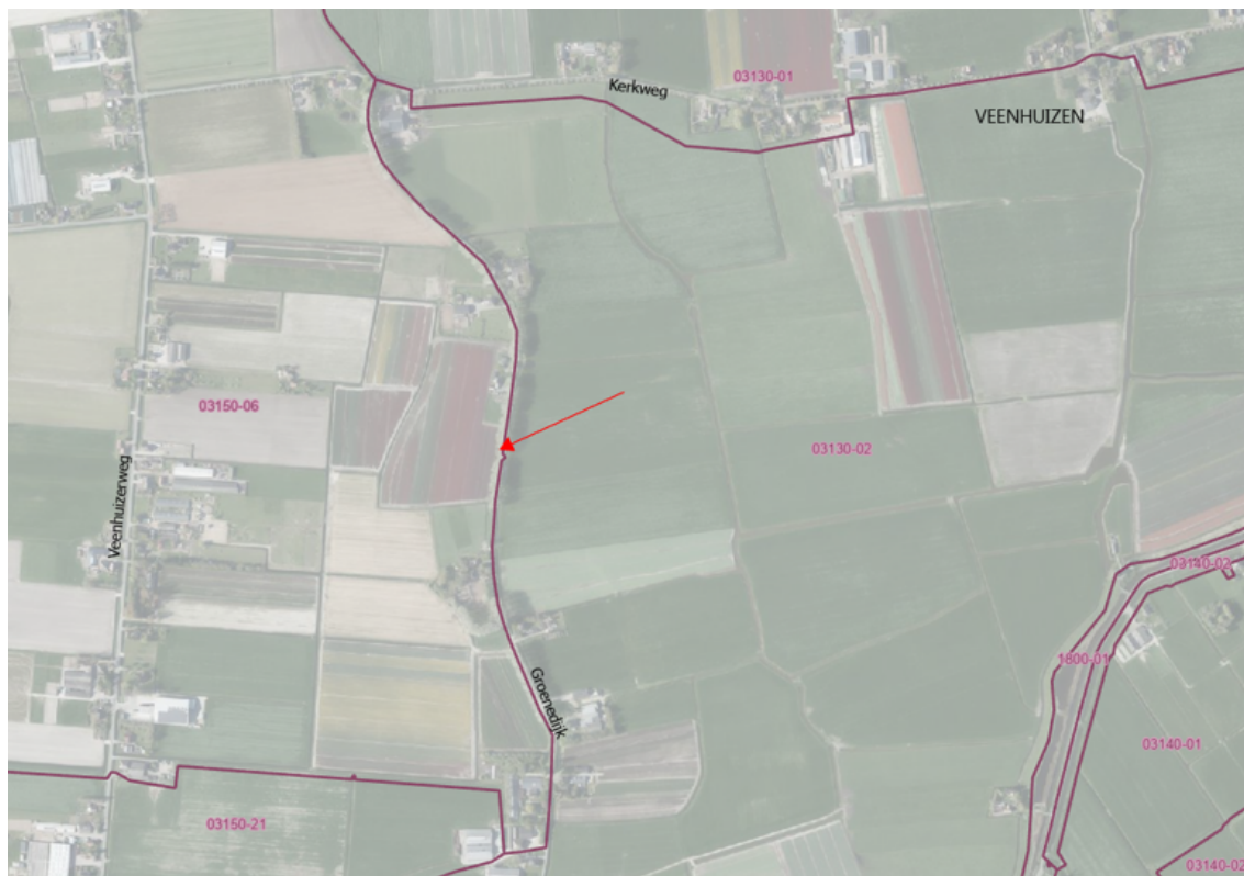
Kaart 1: Peilgrenzen huidige situatie