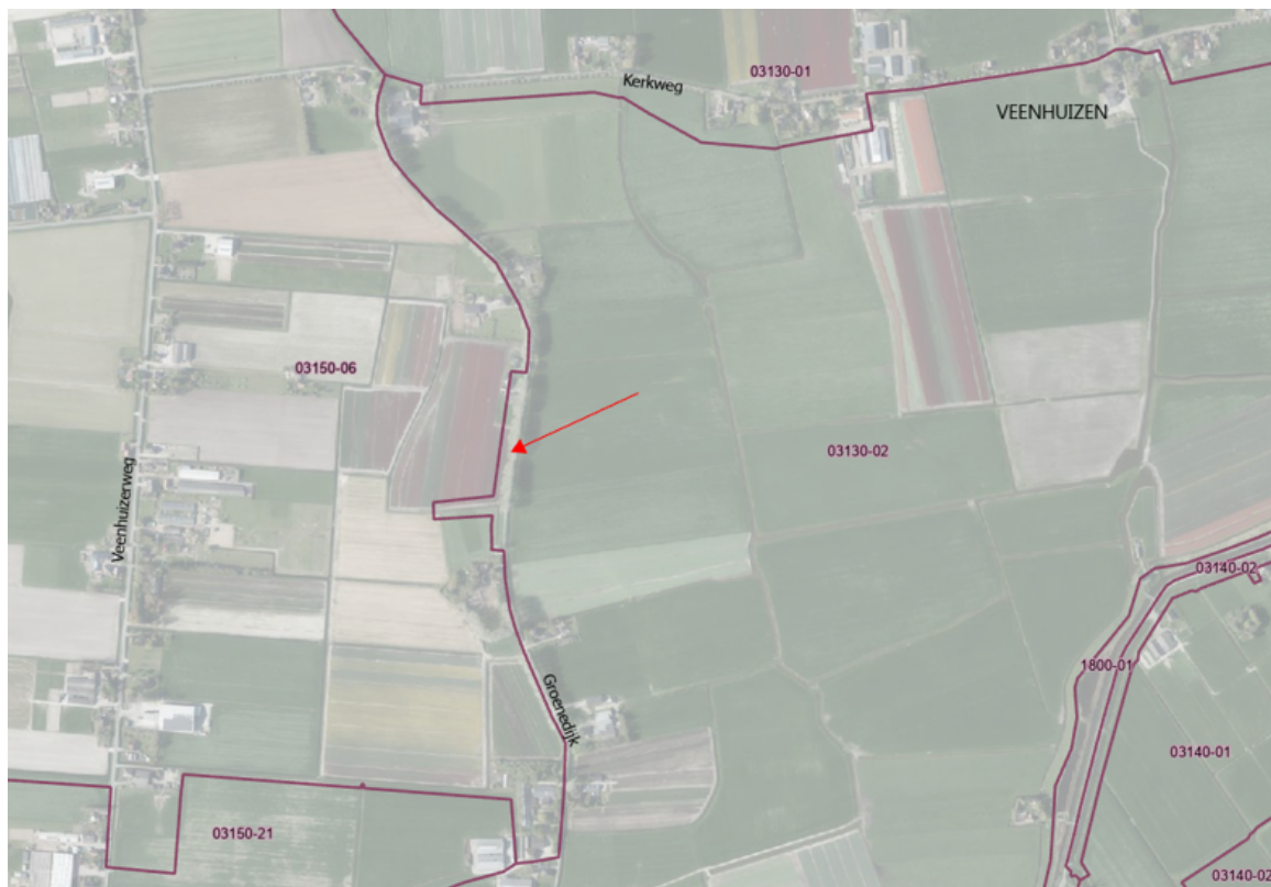
Kaart 2: Peilgrenzen nieuwe situatie