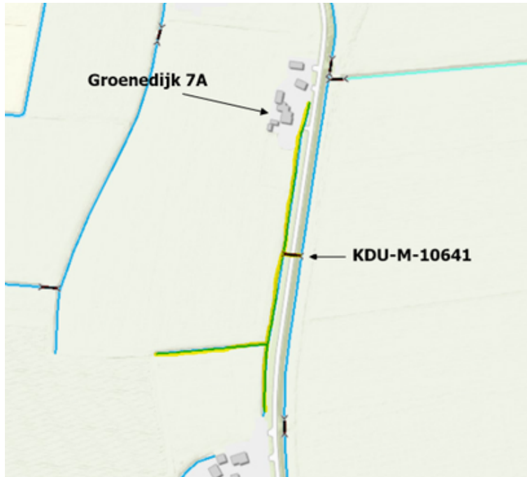
figuur 2: Waterlopen OAF-M-10637, OAF-Q-74140, OAF-OH-1441 en OAF-OH-1440