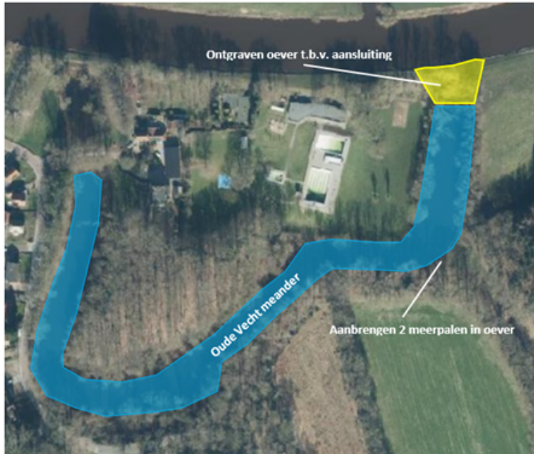
Figuur 2: Locatie werkzaamheden