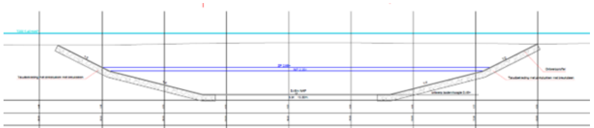
Figuur 4: Dwarsprofiel aansluiten meander Stekkenkamp