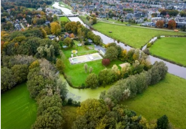
▲ Deze oude Vechtarm in Ommen, vlakbij zwembad Olde Vechte, wordt weer in contact gebracht met de rivier. Door een monding te creëren bij het doodlopende deel op de voorgrond.

Bij dit deel van de beek zit nu een dun strookje grond dat het scheidt van de rivier. Het wateroppervlak is bedekt met een groene deken. Eromheen veel bomen en planten. Riekert: „Het plantje eendenkroos gedijt goed in stilstaand water. Het groeit al snel ongebreideld voort en dekt de bovenkant van het water af. Een groene soep. Zo ontstaat onder de waterspiegel een zuurstofloze situatie. Dat is niet gunstig voor alles wat erin leeft.”