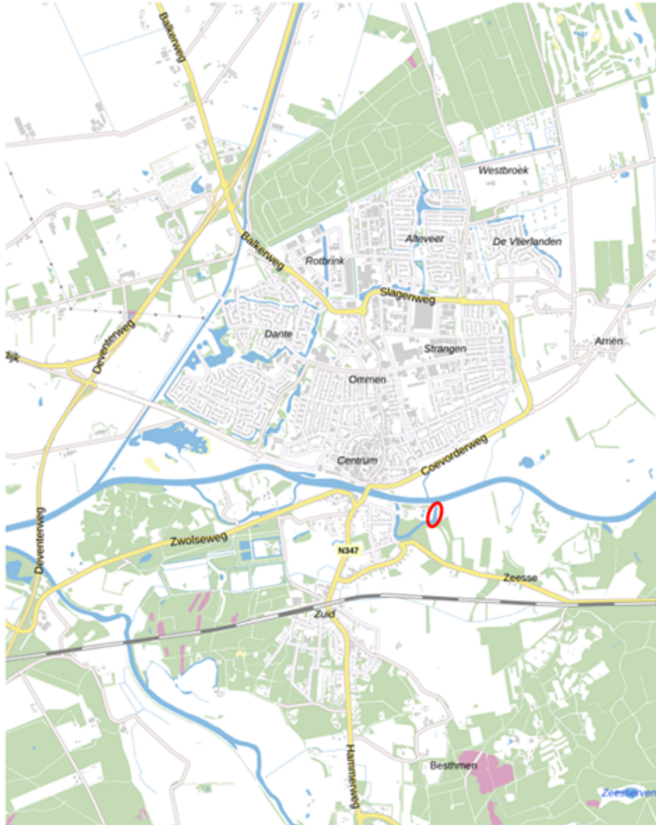
Figuur 1: Ligging plangebied