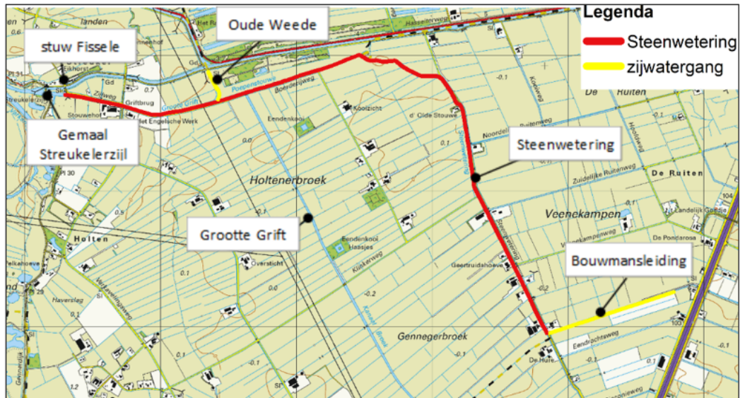
Figuur 1 : Ligging project Steenwetering.

Het gebied is overwegend in agrarisch gebruik als grasland. Verspreid over het gebied komen agrarische bebouingsblokken voor, veelal in de vorm van melkveebedrijven.