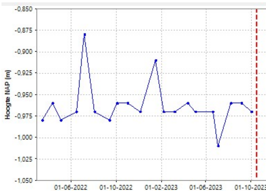
Figuur 3 meetreeks gemeten waterpeilen meetpunt WP 302 9 10