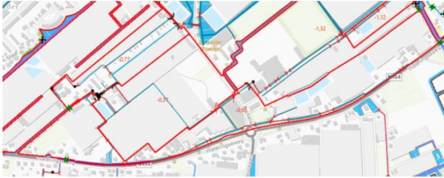
Figuur 2 Kaart met de praktijksituatie van de waterhuishouding