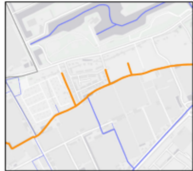
Zijsloot van de Boomawatering