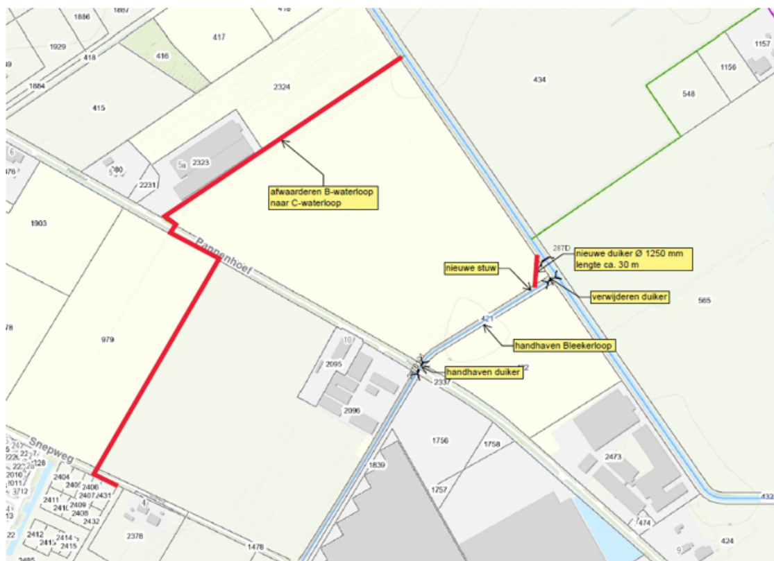
Figuur 2: Wijziging waterstaatswerken

neerslag kan de overstortende straal sterk toenemen. De stuw moet daarom helemaal plat kunnen. Deze stuw wordt niet geautomatiseerd.