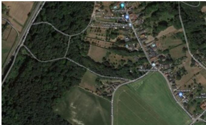
Afbeelding 2 Luchtfoto plangebied