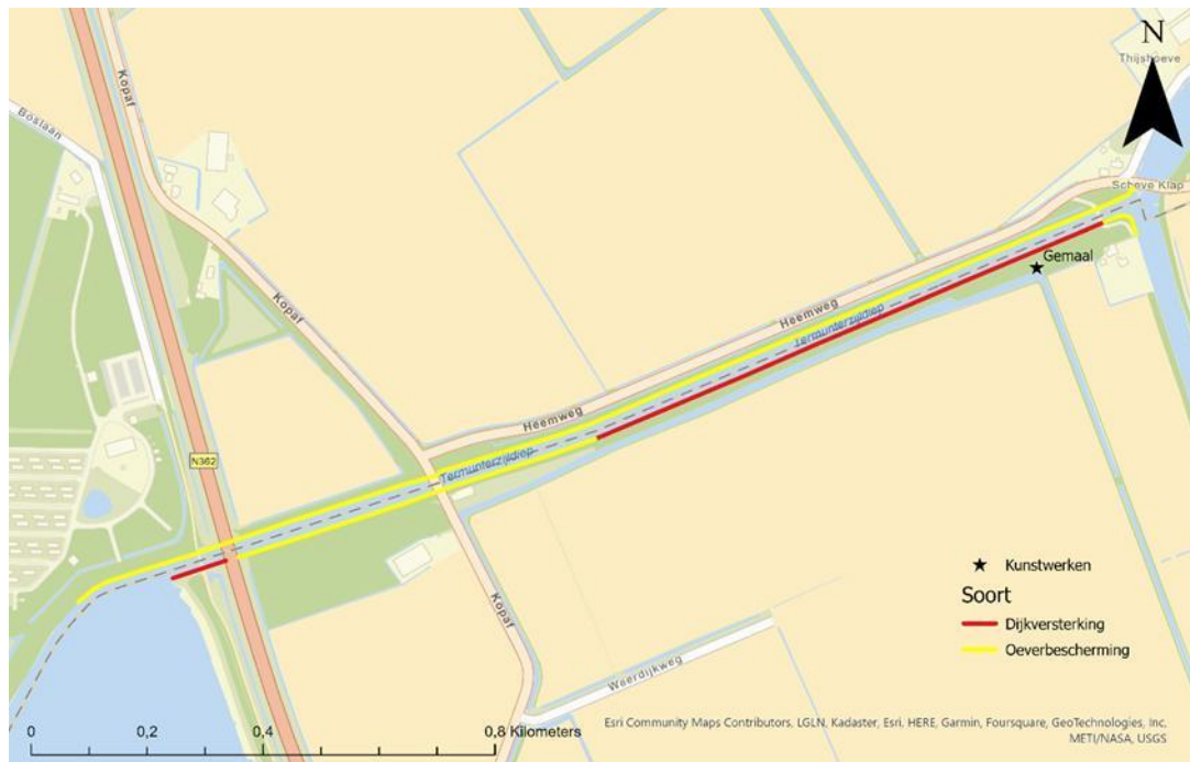
Figuur 1 Dijkversterking Hondshalstermaar

In figuur 1 is te zien om welk traject het gaat met daarbij aangegeven de opgaven. Het waterschap Hunze en Aa's is voornemens de dijk aan de zuidzijde te versterken, weer te laten voldoen aan het vereiste waterveiligheidsniveau en voor het gehele de onderhoudstoestand weer op orde te brengen.