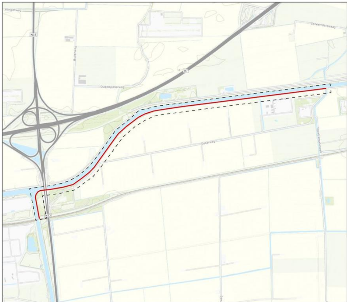
Figuur 1 Dijkversterking Eekerpolder – onderzoeksgebied.

Ten zuidoosten van de kruising tussen de Rijkswegen A7 en de N33 ligt de Eekerpolder. Aan de zuidkant van de A7 ligt het Winschoterdiep. Het Winschoterdiep is verbonden met het A.G. Wildervanckkanaal aan de westkant van de N33. Aan beide zijden van deze kanalen liggen dijken voor bescherming tegen wateroverlast. De dijken aan de zuidzijde van het Winschoterdiep en aan de oostzijde van het A.G. Wildervanckkanaal voldoen niet aan het waterveiligheidsniveau. In figuur 1 is te zien om welk traject het gaat, het onderzoeksgebied. De stabiliteit binnenwaarts is onvoldoende (zie figuur 2) en er is kans op piping (zie figuur 3). Het waterschap Hunze en Aa's is voornemens de dijken te versterken en weer te laten voldoen aan het vereiste waterveiligheidsniveau.