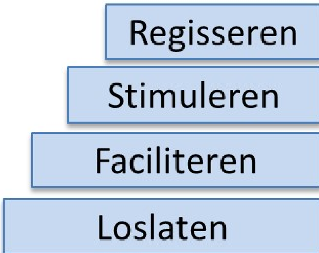
Figuur 2: Overheidsparticipatieladder

Maatschappelijke initiatieven kunnen we op verschillende manieren ondersteunen. We kiezen op basis van de overheidsparticipatietrap onze rol. Deze ladder wordt ook gebruikt bij onze collega-overheden. Waar nodig stemmen wij de te nemen rol met onze collega-overheden af. Bij elk initiatief kijken we welke trede logisch is. In de onderstaande afbeelding lichten we de trap toe.