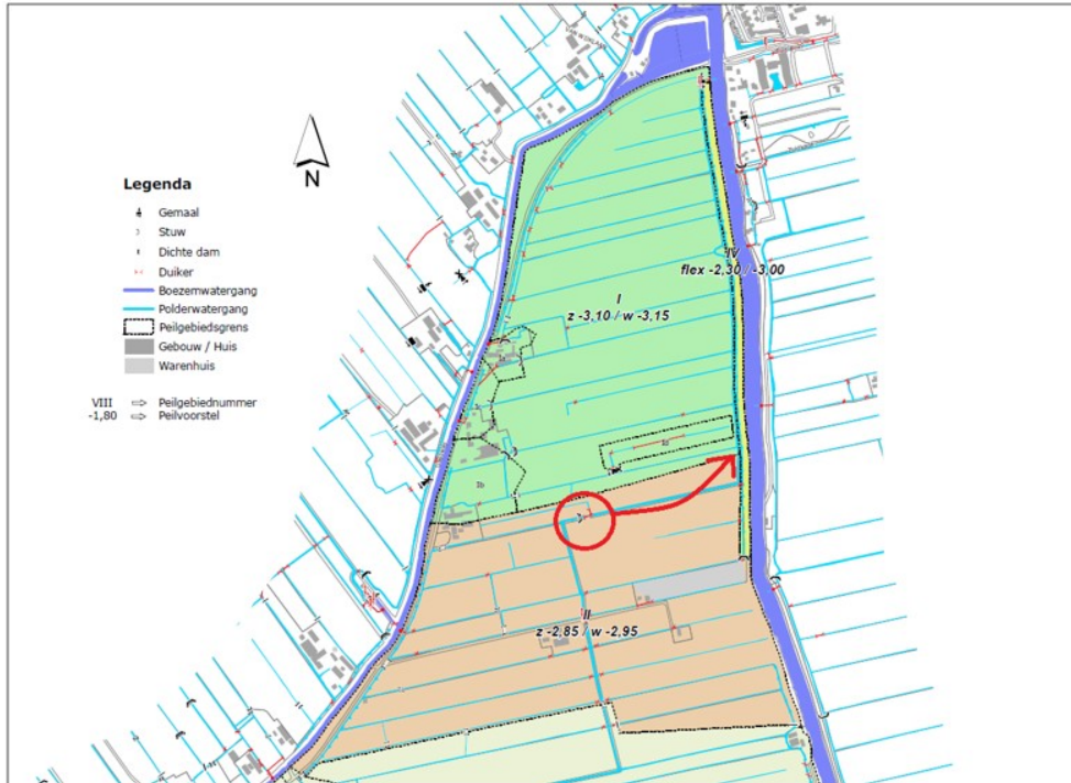
Figuur 1: Gedeelte van de vorige peilbesluitkaart 2014. In de rode cirkel de plaats van de genoemde stuw.