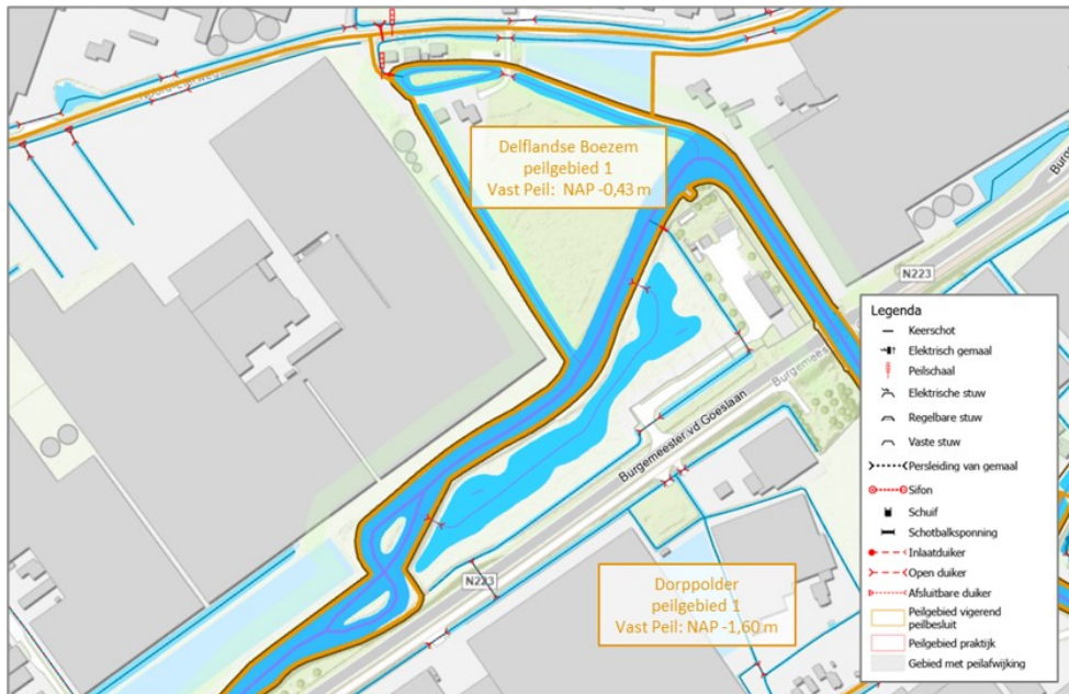
Figuur 1 - Huidig peilbesluitkaart

Het vigerend peilbesluit voor de polder betreft het peilbesluit 'Dorppolder' uit 2013. Het vigerend peil voor peilgebied 1 van de Dorppolder is vastgesteld op een vast peil van NAP -1,60 m.