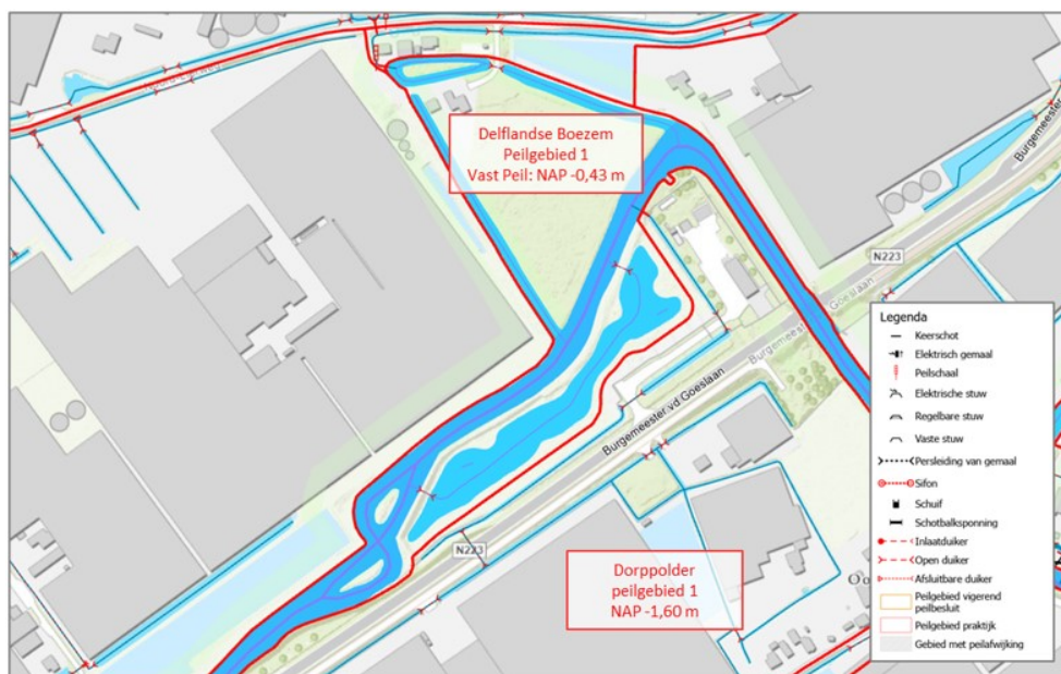
Figuur 2 – Kaart met de situatie in de praktijk

De peilscheiding (de polderkade) liep langs de Lierwatering, maar door de omzetting van het gebied tot natte ecologische zone, en de aanleg van een tweetal duikers is deze peilscheiding doorstoken. Er is in zuidoostelijke richting een nieuwe polderkade aangelegd en de peilscheiding is hiermee opgeschoven. In de huidige situatie is het boezemgebied dus uitgebreid. Het voorgaande polderpeil (NAP -1,60 m) is daarmee omgezet naar het boezempeil (NAP -0,43 m). De waterpartij is onderdeel van het boezemstelsel geworden. Dit water is in beheer bij Delfland.