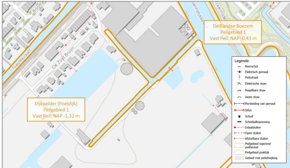
Figuur 1 - Huidige peilbesluitkaart

Het geldende peilbesluit voor de polder betreft het peilbesluit 'Dijkpolder (Poeldijk)' uit het jaar 2006. Voor peilgebied 1 is het peil vastgesteld op NAP -1,32 m.