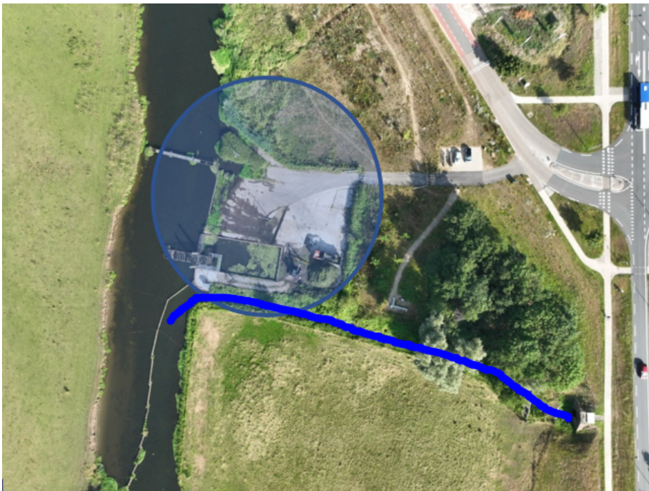
Figuur 2: Bovenaanzicht vuilvang en Kroonbeek