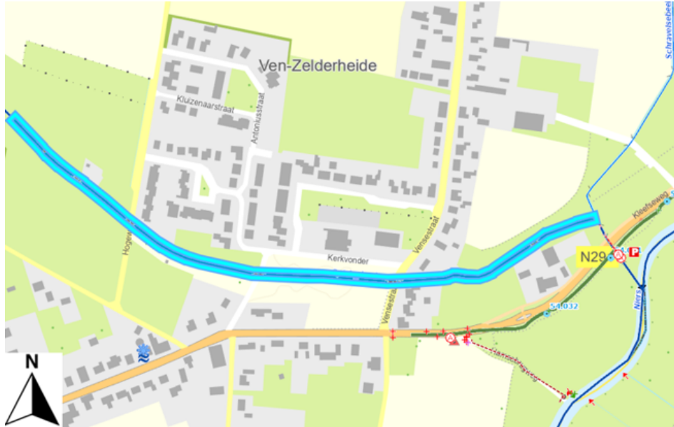
Figuur 1 Plangebied omtrent incorrect verhang beekbodem Spijkerbeek