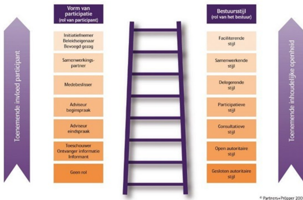
Figuur 1: participatieladder