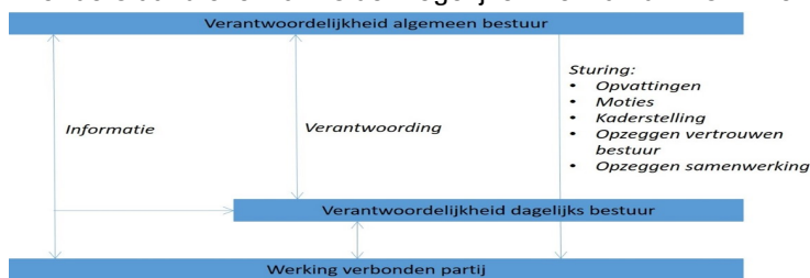
Figuur instrumentarium algemeen bestuur (naar 'Grip op samenwerking in de praktijk', Berenschot/Proof)

In onderstaand overzicht is de mogelijke inzet van dit instrumentarium schematisch weergegeven.