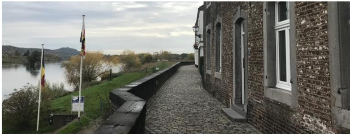
Eijsden: Rijks beschermd Dorpsgezicht

Ruimtelijke ordening behoort tot het taakveld van gemeenten en Provincie. Waterschap Limburg zal in samenwerking met bevoegde gezagen op zoek gaan naar mogelijkheden om met de dijkversterkingsopgave de bestaande ruimtelijke kwaliteit te behouden. Bij de dijkversterkingsplannen en bij de keuze voor het type waterkering zullen de betreffende wet- en regelgeving op de verschillende aspecten worden gevolgd. Zo kan het zijn dat er in een Rijks beschermd dorpsgezicht specifieke eisen aan de verschijningsvorm van een type waterkering worden gesteld.