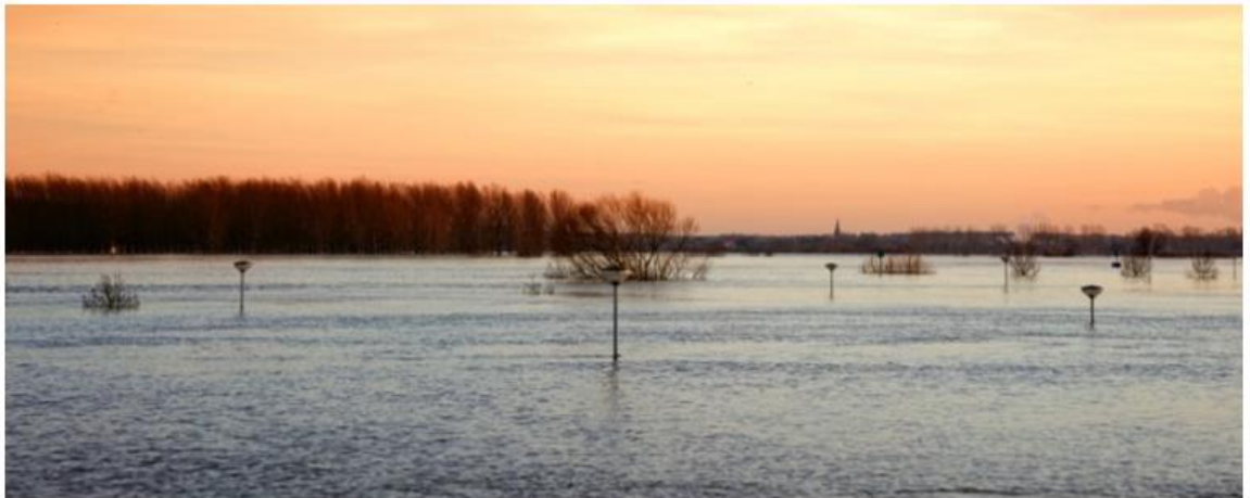
De Maas bij Neer

De ruimte die er mogelijk is om buitenwaarts te versterken is dus afhankelijk van de specifieke lokale situatie. Of er wel of niet een mogelijkheid is om buitenwaarts te versterken heeft een sterke relatie met de keuze voor het type waterkering.