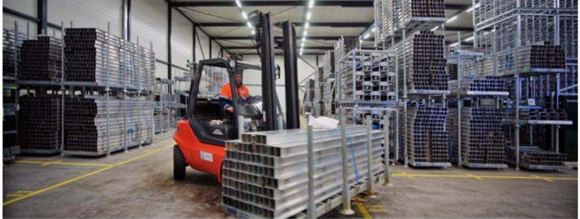
Loods Waterschap Limburg met schotbalken

de primaire waterkeringen. De primaire waterkeringen en kunstwerken moeten veiligheid bieden tijdens een hoogwatercalamiteit. Ten behoeve van de opbouw van demontabele waterkeringen bij hoogwater hebben we circa 8000 schotbalken (stand van zaken 2019), opgeslagen in twee hoogwaterloodsen. Al deze "assets" moeten beheerd en onderhouden worden. Ook de organisatie moet toegerust zijn om nu en straks ons hele areaal te beheren, onderhouden en te functioneren tijdens calamiteiten. Dit vergt dat we de keuzes die we maken voor een type waterkering via deze invalshoek moeten beschouwen. In het Waterbeheerplan en het Beheerplan Waterkeringen (paragraaf 1.3.4) worden de beleidvoornemens en uitgangspunten voor beheer, aanleg en verbetering van de waterkeringen in ons beheergebied beschreven.