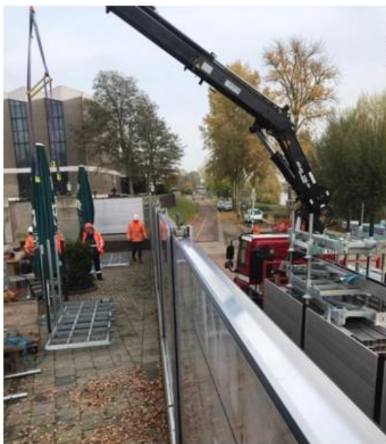
Opbouw van demontabele waterkering in Blerick

Voor alle niet-permanent gesloten systemen geldt dat bereikbaarheid een bijzonder punt van aandacht is. Niet-permanent gesloten systemen vergen doorgaans veel onderhoud en moeten intensief geïnspecteerd en regelmatig getest/opgebouwd worden. Ook kan de levensduur van bepaalde onderdelen minder zijn dan de standaard (doorgaans 100 jaar voor een permanent gesloten waterkering) en moet er dus vóór aanleg al bewust worden nagedacht hoe die onderdelen te zijner tijd kunnen worden vervangen: welk materieel moet daarvoor ter plaatse kunnen komen via welke routes. Bovendien moet, vanwege de grotere faalkans(uitleggen) (niet tijdig kunnen sluiten door bijvoorbeeld logistieke problemen of door een mankement in het systeem) het handelings-perspectief in geval van calamiteiten goed zijn geborgd. Dan gaat het bijvoorbeeld om het met een vrachtwagen en kleine kraan ter plaatse kunnen plaatsen van bigbags. Doorgaans zal daarom bij niet-permanent gesloten systemen een bereikbaarheidsstrook van 4 meter aan weerszijden benodigd zijn. Mede daardoor ligt toepassing in de openbare ruimte meer voor de hand dan op particulier terrein. De hogere inspectiefrequentie kan ook gevolgen hebben voor de privacy-beleving van omwonenden, in vergelijking met bijvoorbeeld een (gedeeltelijk) glazen waterkering welke minder intensief geïnspecteerd wordt.