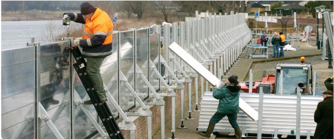
Testen opbouw demontabele kering

Voor de beoordeling van de bereikbaarheid wordt uitgegaan van het huidige algemeen gangbaar onderhoudsmaterieel (vrachtwagens en tractoren e.d.) waarmee efficiënt en kosteneffectief kan worden gewerkt.