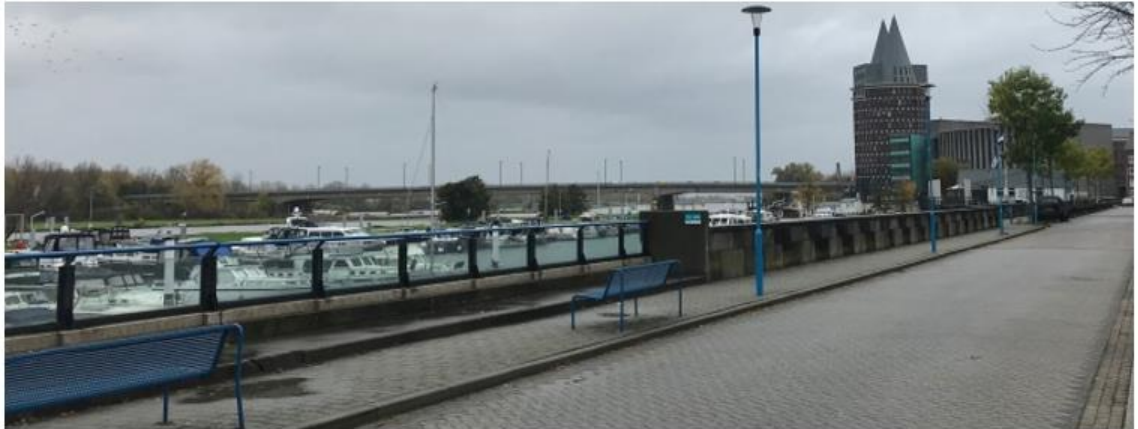
Glazen waterkering in Roermond

Hierbij is het van belang om te weten dat er juridisch gezien géén blijvend recht op behoud van uitzicht op de Maas bestaat. Zie ook paragraaf 3.5. Dit uitgangspunt kent jurisprudentie en geldt voor alle typen waterkeringen. Vanuit de gedachte dat met maatschappelijke gelden sober en doelmatig dient te worden omgegaan zal het toepassen van een glazen waterkering ten behoeve van de kwaliteit van de leefomgeving in een openbare omgeving zwaarder wegen dan in geval van privébelangen. Er is wel regelgeving (Bouwbesluit, of wanneer Omgevingswet van kracht is: het Besluit bouwwerken Leefomgeving Bbl) over lichtinval in panden/woningen in relatie tot leefbaarheid.