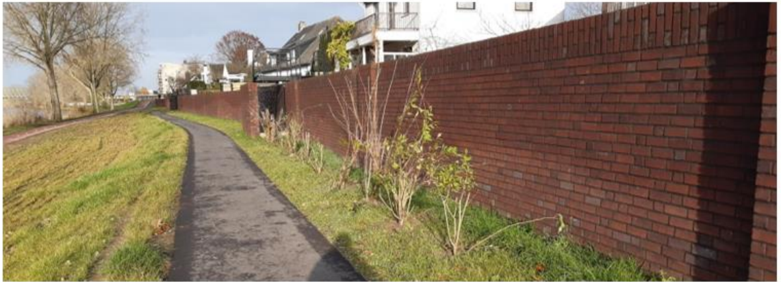
Harde waterkering in Mook

Afhankelijk van het specifieke ontwerp (hoogte, overslag), kan een verharding of een gesloten grasmat nodig zijn aan binnendijkse zijde, met het oog op het voorkomen van een erosiekuil. Het is van belang de (on)wenselijkheid hiervan in de omgeving ter plaatse mee te nemen in het ontwerp en andersom.