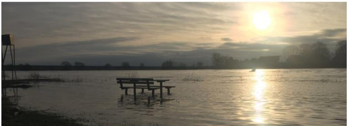
De Maas bij Well

Eenmaal per twaalf jaar, conform de Waterwet, voert het Waterschap een "Beoordeling veiligheid primaire keringen" uit. Er wordt dan bepaald wat de toestand van de kering is en wat er moet gebeuren om te voldoen aan de normen uit de Waterwet. Door de ontstaansgeschiedenis van het huidige areaal aan waterkeringen, ruimtelijke ontwikkelingen, veranderingen in het klimaat en de overgang van overschrijdingskans naar overstromingsrisico (normwijziging) in de Waterwet voldoet een groot deel van onze keringen niet aan de wettelijke eisen die van toepassing zijn voor primaire waterkeringen. Conform de Waterwet dienen de waterkeringen in Nederland in 2050 aan de norm te voldoen. Dit betekent een stevige opgave aan dijkverbeteringen met als doel bewoners en bedrijven in de toekomst voldoende te kunnen beschermen tegen overstromingen van de Maas.