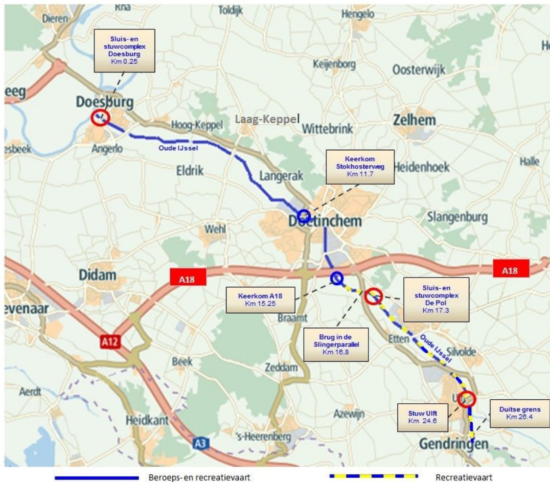
Figuur 1: beroeps- en recreatievaart op de Oude IJssel