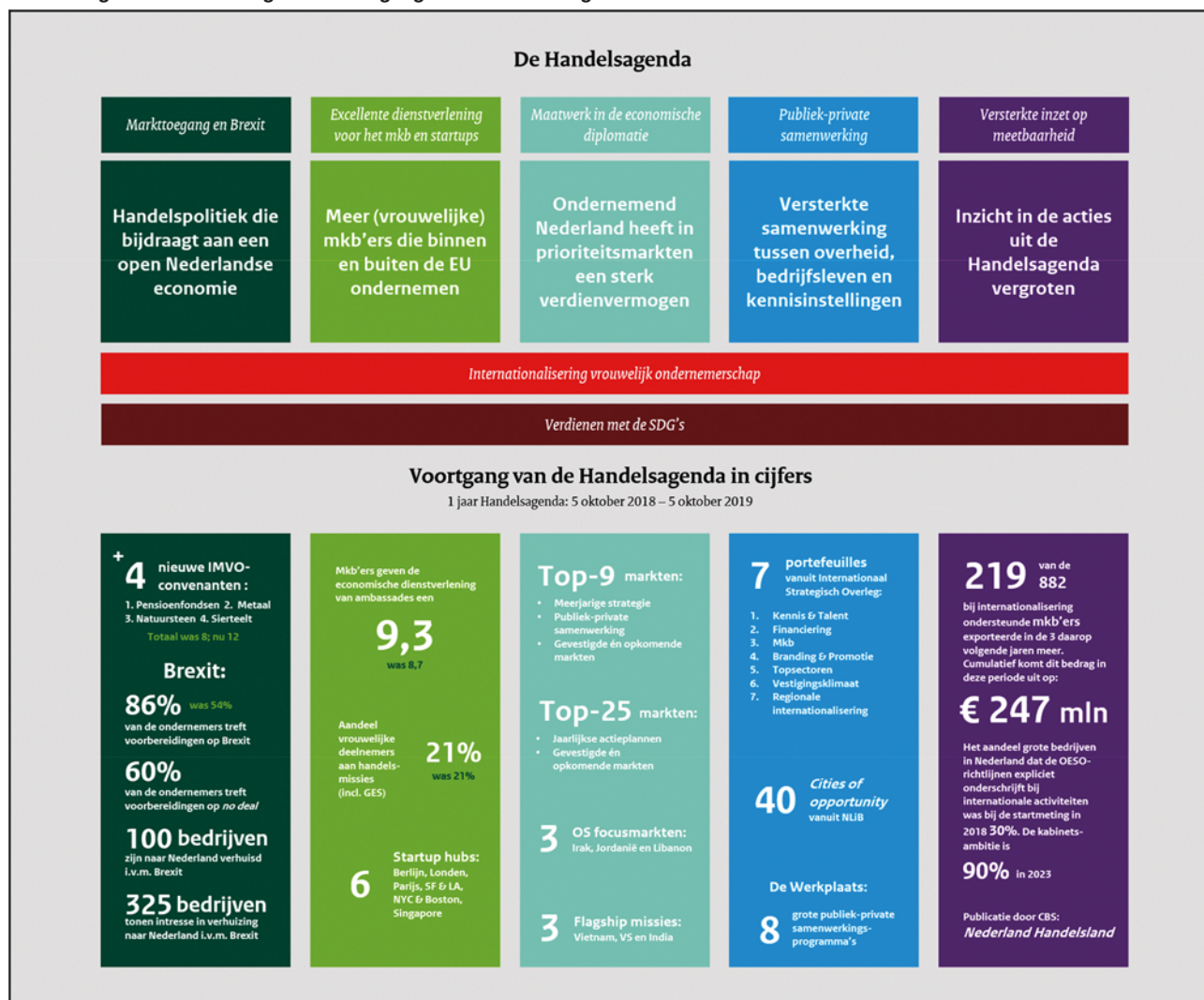
Afbeelding 1: de doelstellingen en voortgang van de Handelsagenda

Per actielijn worden hieronder de inzet van het kabinet en de behaalde resultaten beschreven.