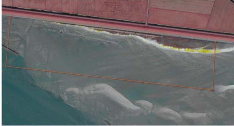
Infrarood afbeelding (2025) met de in 2025 ingemeten nesten (N=239, gele stip) en de begrenzing van het TBB (in broedseizoen gesloten) gebied. De 4 rode hoekpunten en de oranje lijn vormen de huidige begrenzing van het gesloten gebied.

Ten aanzien van de Feugelpôle en de aanwezige broedvogels in de afgelopen jaren kunnen de volgende conclusies worden getrokken: