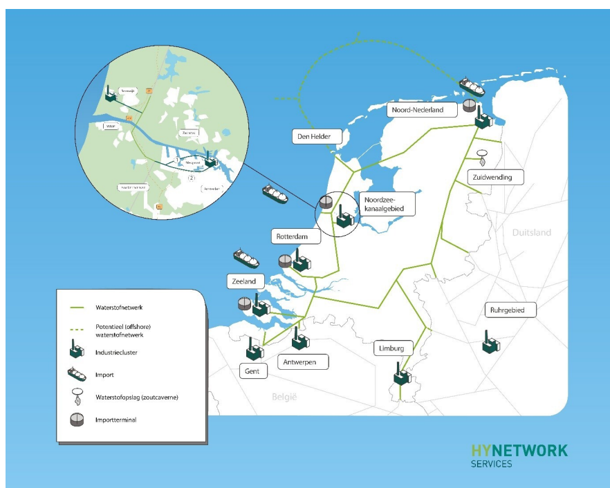
Figuur 1.1 Waterstofnetwerk Nederland

Het Waterstofnetwerk Noordzeekanaalgebied wordt daarnaast als een zelfstandig functionerend netwerk ontwikkeld. Het Waterstofnetwerk Noordzeekanaalgebied wordt, zodra dat mogelijk is, wel gekoppeld aan het landelijke Waterstofnetwerk Nederland.