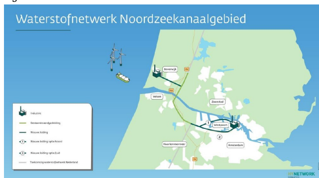
Figuur 1.2 Waterstofnetwerk Noordzeekanaalgebied

Op grond van artikel 5.44, eerste lid, van de Omgevingswet (hierna: Ow) en de Kamerbrief van 1 april 2022 (kenmerk DGKE-WO/22031946) wordt het projectbesluit over de waterstofinfrastructuur van dit project genomen door de Minister voor Klimaat en Energie (thans de Minister van Klimaat en Groene