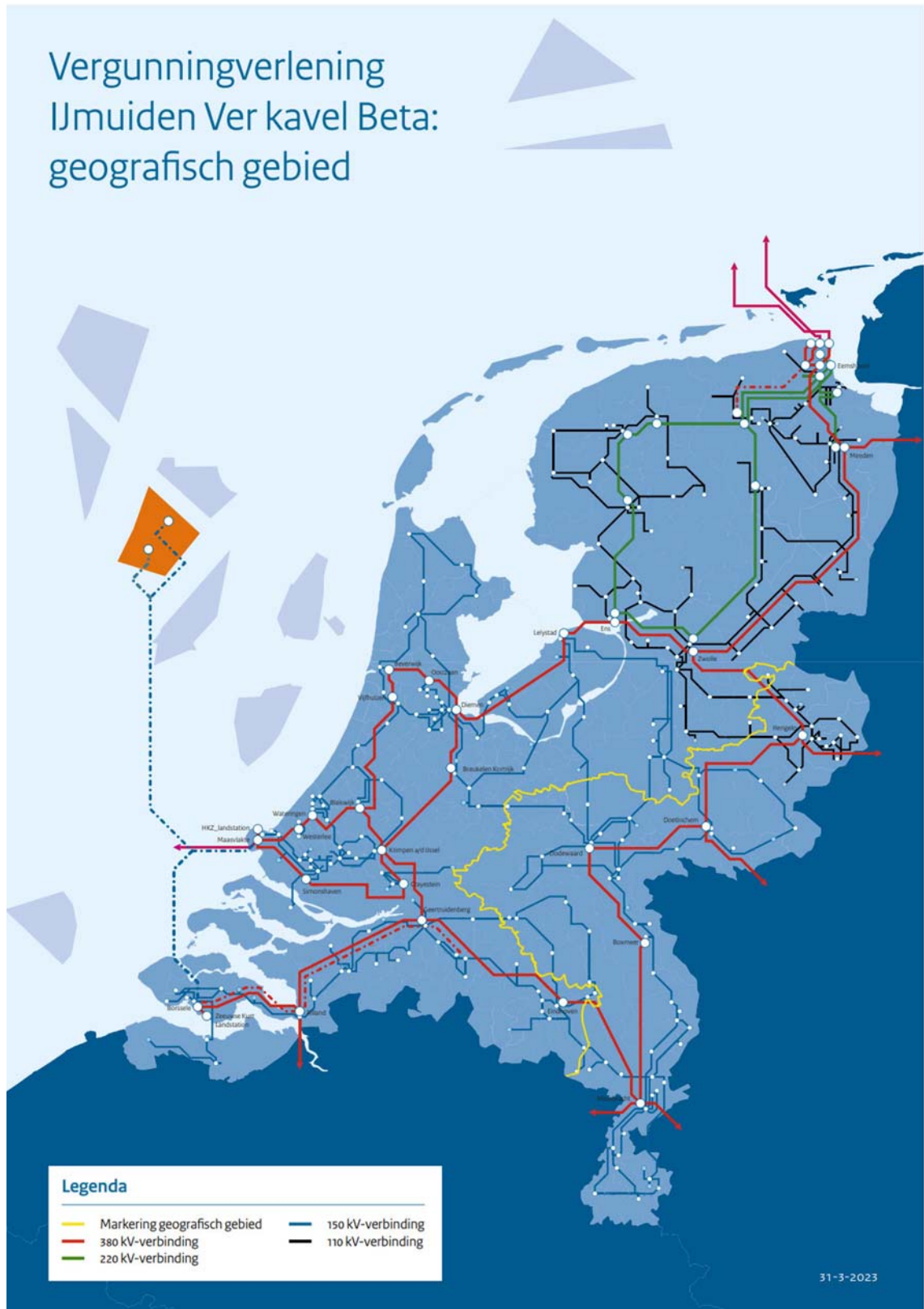
Figuur 1: Vergunningverlening IJmuiden Ver kavel Beta: markering geografisch gebied

1.5 Om te borgen dat de vergunninghouder zich conform de aanvraag houdt aan het volgen van het leveringsprofiel van de productie-installatie(s) in de kavel, ten minste bij invoeding vanaf de drempelwaarde (zie beoordelingsmaatstaf), wordt in de vergunning de verplichting opgenomen dat de vergunninghouder hierover jaarlijks rapporteert. Op basis van deze rapportage, kan de Minister voor Klimaat en Energie vaststellen of al dan niet is voldaan aan deze verplichting. Het volgen van het leveringsprofiel vanaf de drempelwaarde geldt tot en met 31 december 2040. Over het laatste jaar dat