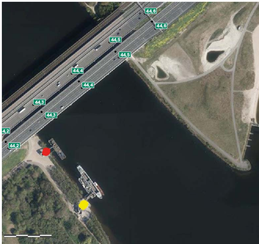
Rode stip: loslocatie km 0,100 Gele stip: loslocatie km 0,300

Voor het veilig uitvoeren van de loswerkzaamheden is het wenselijk om de recreatiedoorvaart aan de zuidoostzijde van de Hollandse Brug af te sluiten voor scheepvaartverkeer door middel van het plaatsen van borden. Tevens is het wenselijke om het scheepvaartverkeer te informeren over de aanwezige loslocatie(s). Het afsluiten van de recreatiedoorvaart aan de zuidoostzijde van de Hollandse Brug en plaatsen van de borden kan mogelijk worden gemaakt door het nemen van het Verkeersbesluit.