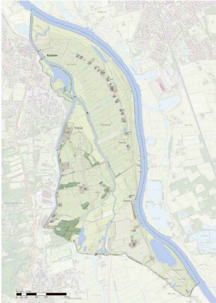
Figuur 1: Kaart gebied Hoenwaard2030