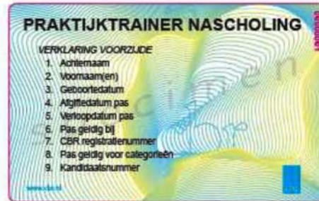
achterzijde indruk Praktijktrainer Nascholing