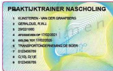
voorzijde indruk Praktijktrainer Nascholing