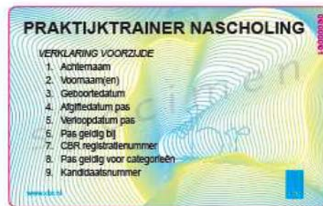
achterzijde indruk Praktijktrainer Nascholing