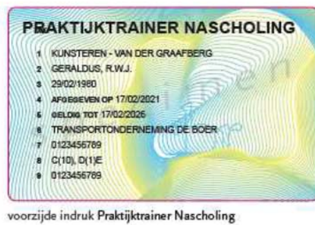
voorzijde indruk Praktijktrainer Nascholing