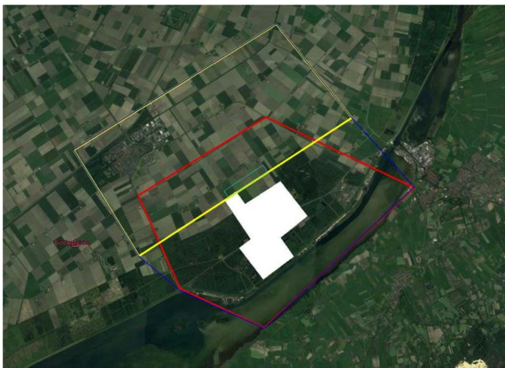
Figuur 3: TGB Biddinghuizen en Biddinghuizen Airshow