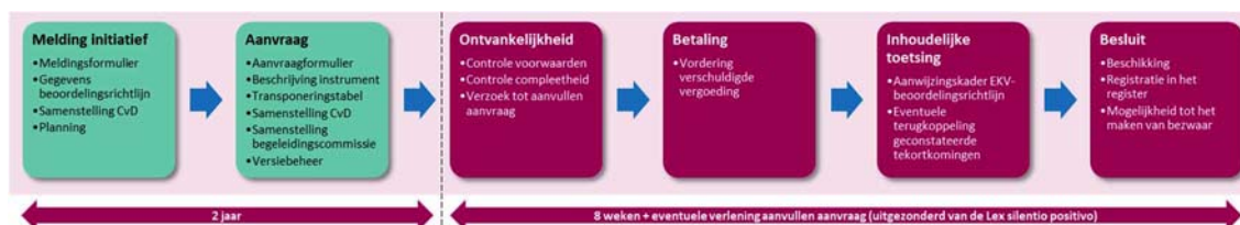
Figuur 3: Proces aanwijzing beoordelingsrichtlijn erkend stelsel

Dit hoofdstuk beschrijft aan de hand van zes stappen de aanwijzing van een beoordelingsrichtlijn voor erkenning van kwaliteitsverklaringen voor de bouw (hierna: beoordelingsrichtlijn). Het proces start met een aanvrager (schemabeheerder) die melding doet van een initiatief voor het opstellen van een nieuwe beoordelingsrichtlijn. Na vaststelling van de nieuwe beoordelingsrichtlijn door het College van Deskundigen doet de schemabeheerder een aanvraag om aanwijzing, waarbij de aanvrager de informatie levert die onderdeel dient uit te maken van de aanvraag. Op basis van deze informatie toetst de TloKB de aanvraag op volledigheid en inhoud. Alleen wanneer aan alle criteria van het aanwijzingskader 15 is voldaan, wijst de TloKB, namens de Minister voor Volkshuisvesting en Ruimtelijke Ordening (VRO), de beoordelingsrichtlijn aan en laat deze toe tot het erkende stelsel van kwaliteitsverklaringen voor de bouw.