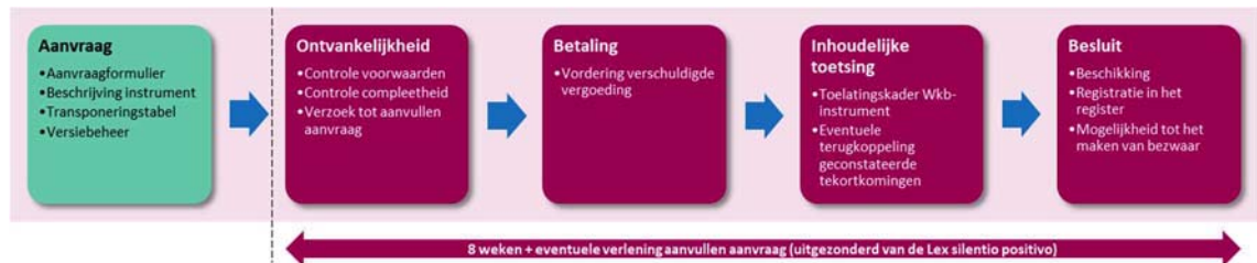
Figuur 2: Proces toelating instrument voor kwaliteitsborging bouw

Dit hoofdstuk beschrijft aan de hand van vijf stappen de toelating van een instrument voor kwaliteitsborging voor het bouwen (hierna: instrument). Het proces start met een aanvraag om toelating, waarbij de aanvrager de informatie levert die onderdeel dient uit te maken van de aanvraag. Op basis van deze informatie toetst de TloKB de aanvraag op volledigheid en inhoud. Alleen wanneer aan alle criteria van het “Toelatingskader Wkb-instrument” (hierna: toelatingskader) is voldaan, laat de TloKB het instrument toe tot het stelsel van kwaliteitsborging voor het bouwen.