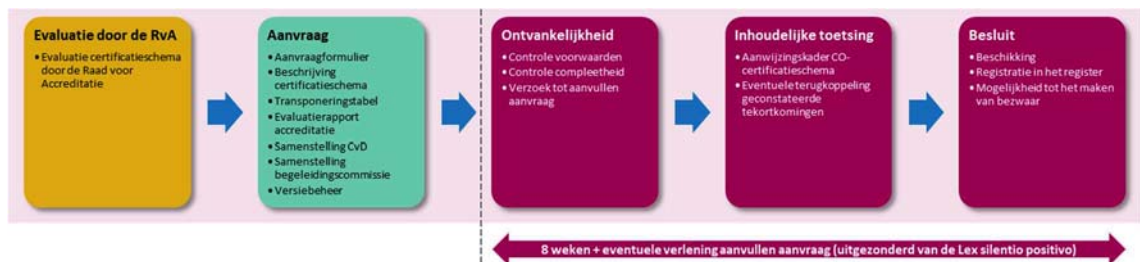
Figuur 4: Proces aanwijzing certificatieschema voor werkzaamheden aan gasverbrandingsinstallaties

Dit hoofdstuk beschrijft aan de hand van vier stappen de aanwijzing van een certificatieschema voor werkzaamheden aan gasverbrandingsinstallaties (hierna: certificatieschema). Voorafgaand aan het proces van toetsing en aanwijzing laat de schemabeheer het certificatieschema evalueren door de nationale accreditatie-instantie, bedoeld in artikel 2, eerste lid, van de Wet aanwijzing nationale accreditatie-instantie (Raad voor Accreditatie). Het proces start met een aanvraag om aanwijzing, waarbij de aanvrager de informatie levert die onderdeel dient uit te maken van de aanvraag. Op basis van deze informatie toetst de TloKB de aanvraag op volledigheid en inhoud. Alleen wanneer aan alle criteria van het "Aanwijzingskader CO-certificatieschema (hierna: aanwijzingskader) is voldaan, wijst de TloKB, namens de Minister voor Volkshuisvesting en Ruimtelijke Ordening (VRO), het certificatieschema aan en laat deze toe tot het stelsel van certificering voor werkzaamheden aan gasverbrandingsinstallaties.