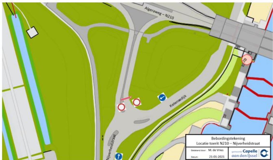
Bebordingstekening Algeraweg – N210 - Nijverheidstraat