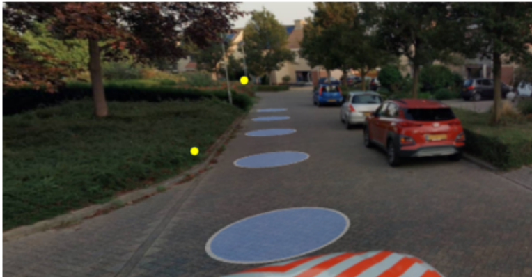
Gele stip locatie flespaal met E01