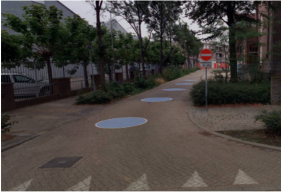
Foto 1: Aansluiting De Wieër op de Parklaan, huidige bord C2 te vervangen door C3