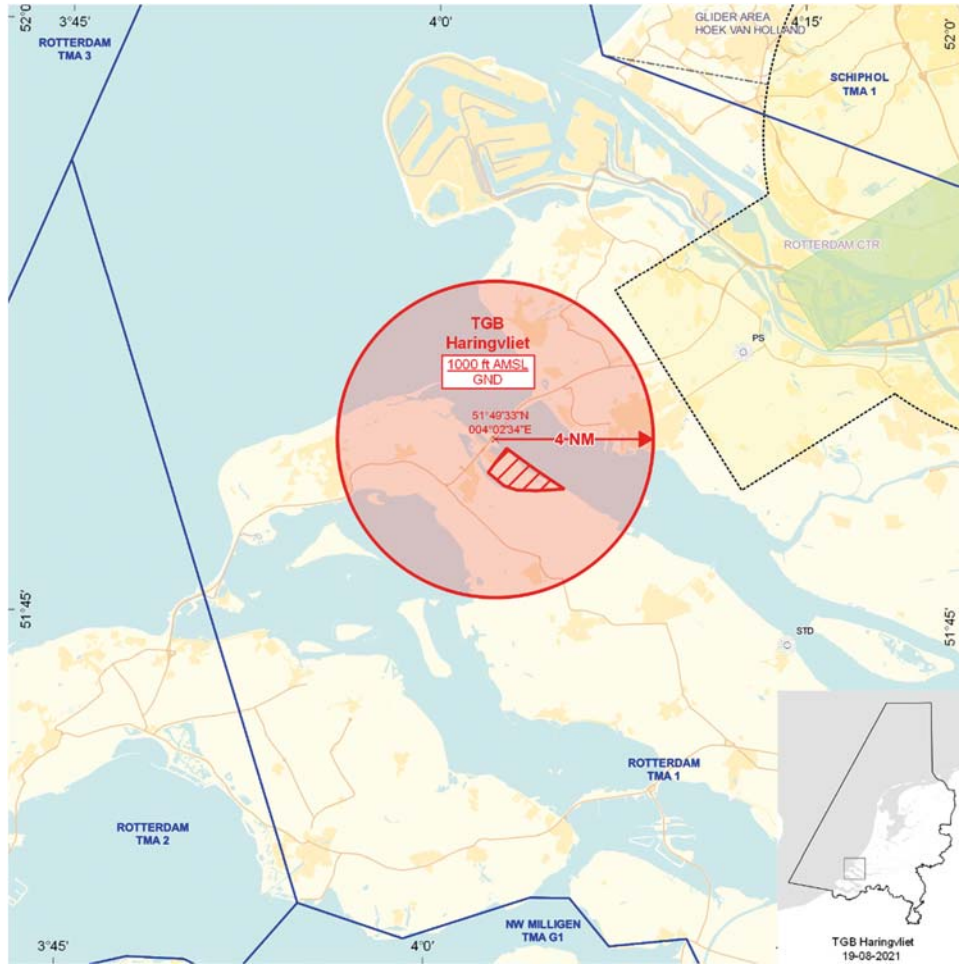
Figuur 1: TGB Haringvliet