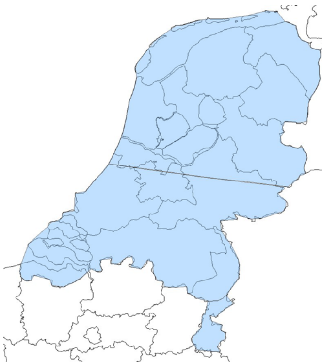
Figuur 2. Overzicht allotment 11C, bestaande uit de allotments HOL2201H, HOL2202H, HOL2203H. De punten waaruit de omtrek van elk allotment is opgebouwd zijn op een USB-stick opgenomen. Deze USB-stick maakt onderdeel uit van bijlage II.