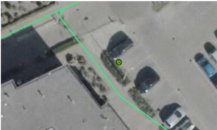
5. Laadpaal ID 0879-46: Burgemeester Manderslaan 56A, 4881 EK Zundert Coördinaten: 51.469432408847666, 4.6657277293384425