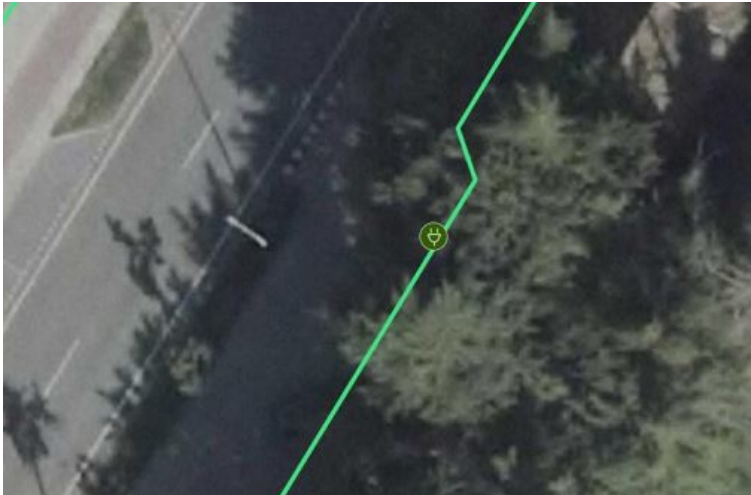
4. Laadpaal ID 0879-45: Antoon Jurriensplein 15, 4884 BA Wernhout Coördinaten: 51.454024945526896, 4.641206735796743