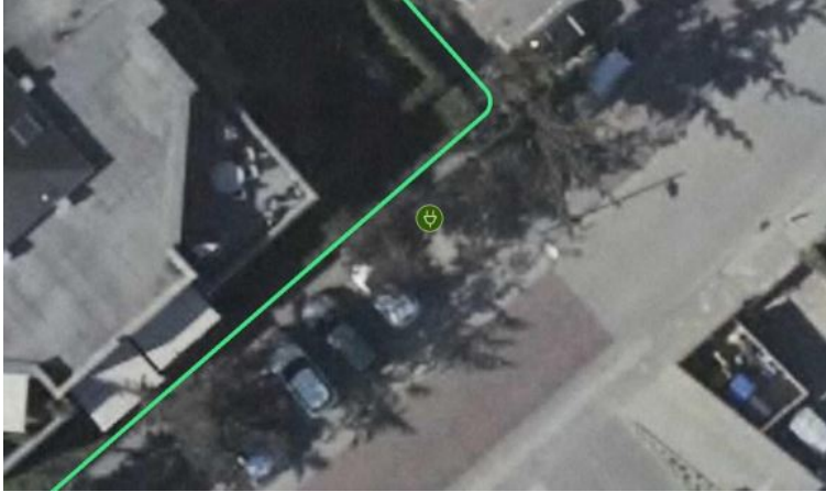
7. Laadpaal ID 0879-55: Klein Zundertseweg 60, 4882 BH Zundert Coördinaten: 51.48180657158076, 4.653815818153106