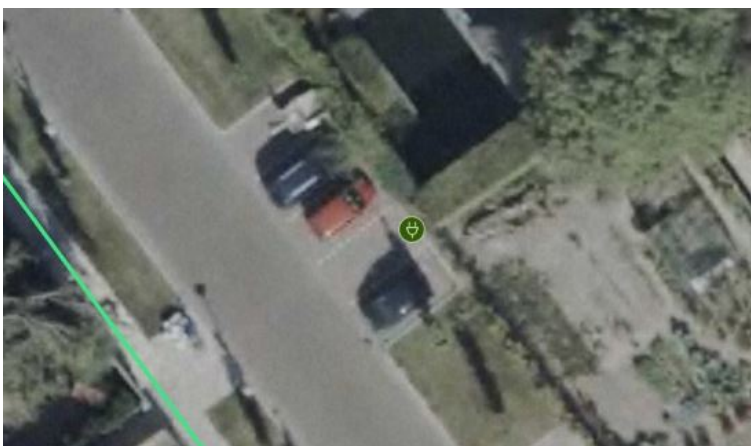
6. Laadpaal ID 0879-50: Beukenlaan 39, 4881 KA Zundert Coördinaten: 51.47238417384378, 4.6625634298672765