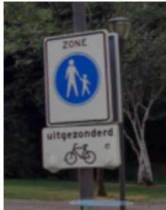
Voorzijde 'start voetgangerszone' (bord G07zb)

Foto 1 De te verwijderen bebording en de te plaatsen bebording: