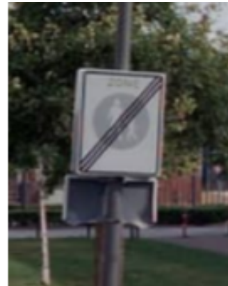
Achterzijde 'einde voetgangerszone' (bord G07ze)

Foto 2 Indicatie plek waar borden dienen te worden verwijderd (blauwe blokjes)