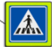
Voetgangersoversteekplaats en fietsoversteek Stadsmolen-Dr. Albert Schweitzerdreef