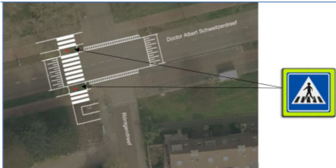
Voetgangersoversteekplaats Röntgendreef-Dr. Albert Schweitzerdreef

Als u op de uitspraak in bezwaar niet kunt wachten en snel een voorlopige maatregel nodig is, kunt u de rechter daar om verzoeken. Dat verzoek kunt u indienen bij de voorzieningenrechter van de Arrondissementsrechtbank Rotterdam, postbus 50951, 3007 BM te Rotterdam. Dit kan alleen als u het bezwaarschrift al bij het college van burgemeester en wethouders heeft ingediend. Met uw verzoek aan de rechtbank moet u een kopie van het bezwaarschrift meesturen. Als u van deze mogelijkheid gebruik maakt, wordt u griffierecht berekend.