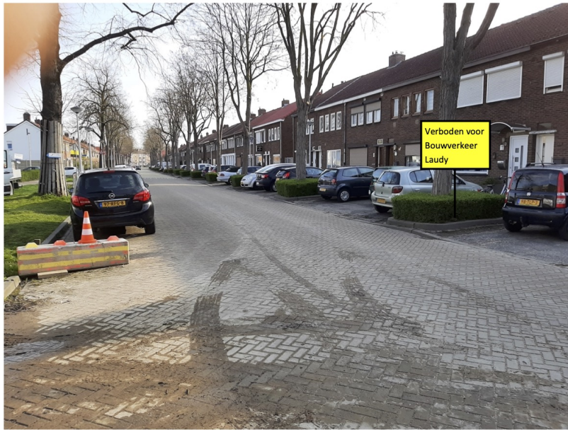
Bord 'verboden voor bouwverkeer Laudy' plaatsen op nieuwe flespaal. Ok bord 2.2m hoog