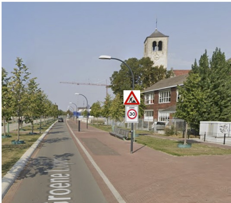
Bord J16 + A01-30-ZB mon- teren op lantarenpaal. Ok bord 2.2m hoog