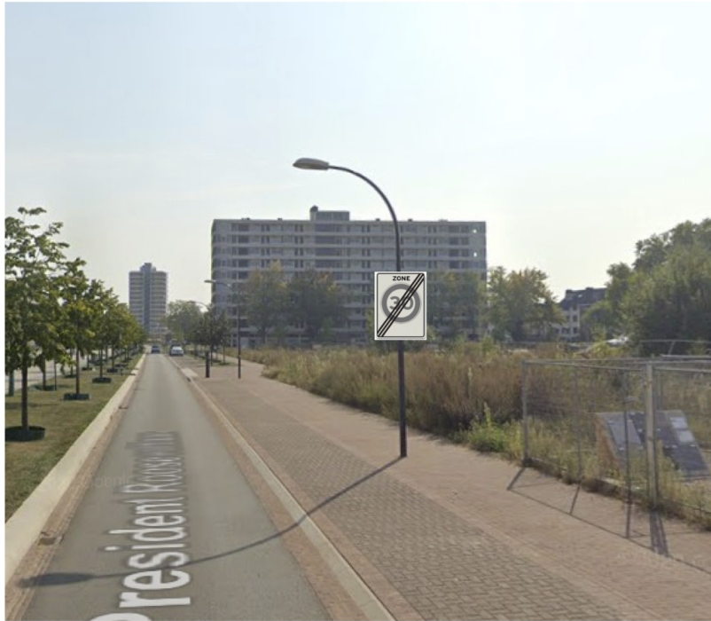
Bord J16 + A02-30-ZB mon- teren op lantarenpaal. Ok bord 2.2m hoog