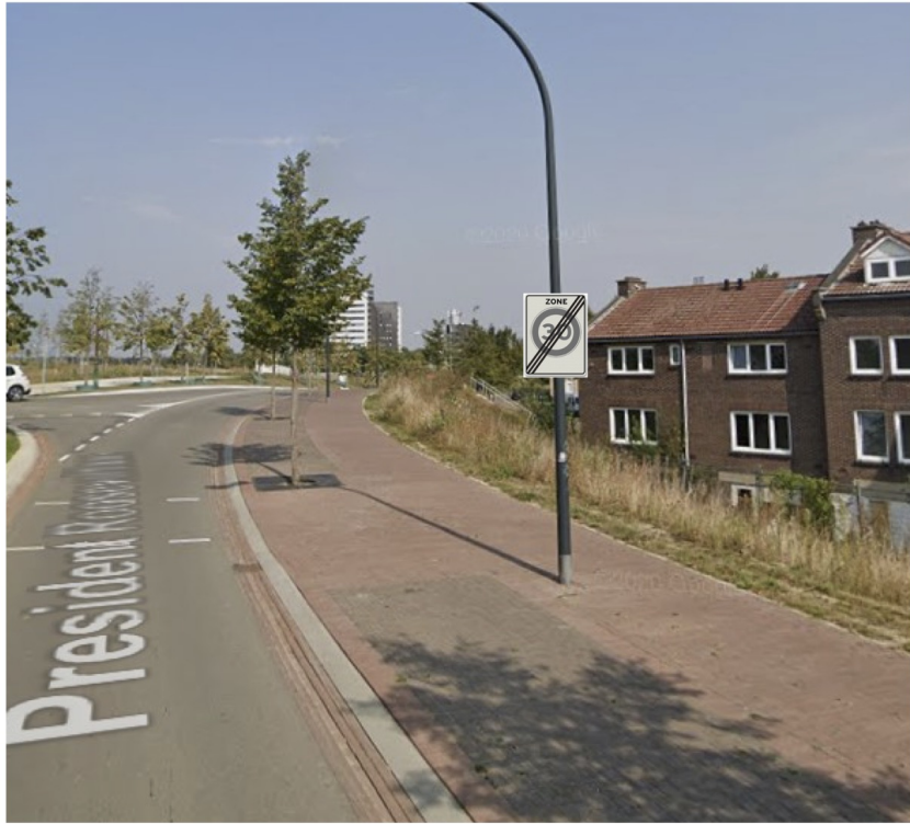
Bord J16 + A02-30-ZB mon- teren op lantarenpaal. Ok bord 2.2m hoog