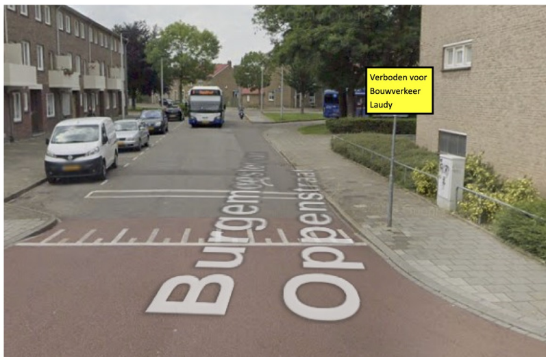
Bord 'verboden voor bouwverkeer Laudy' plaatsen op bestaande flespaal. Ok bord 2.2m hoog