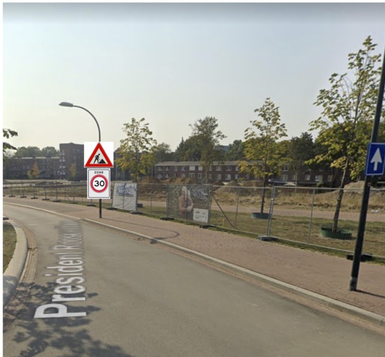
Bord J16 + A01-30-ZB mon- teren op lantarenpaal. Ok bord 2.2m hoog