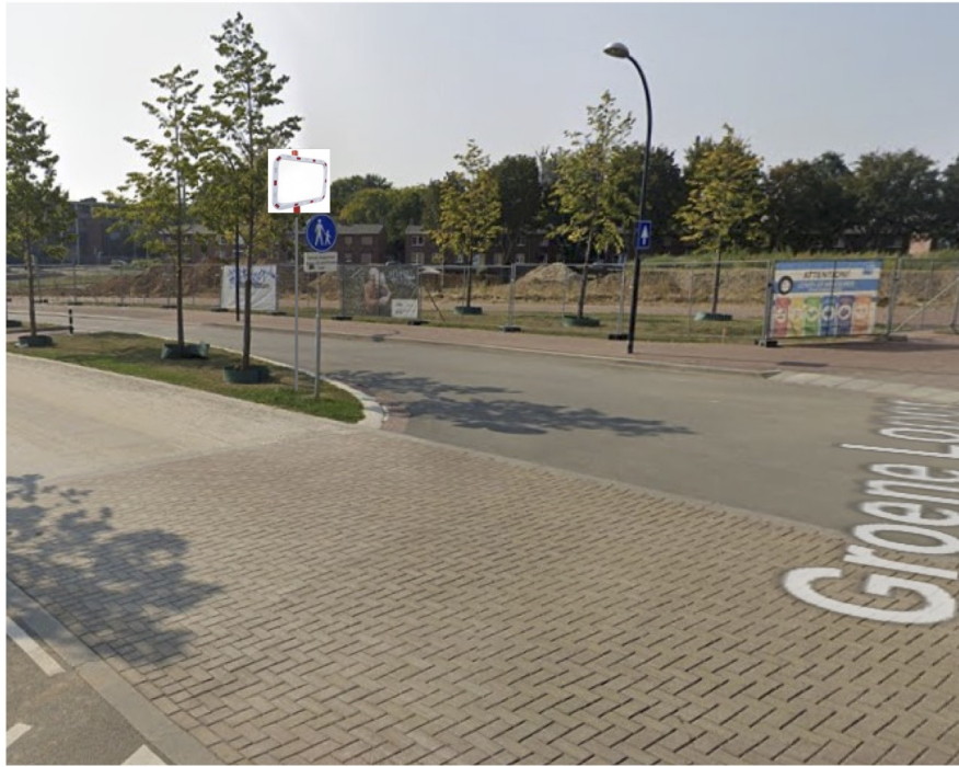
Spiegel op nieuwe flespaal boven bestaand verkeers- bord.