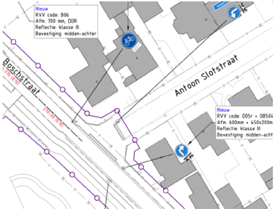
Te plaatsen bebording (3)