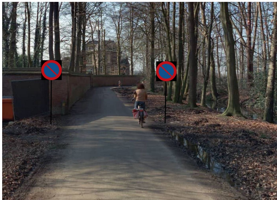
Situatieschets Kloosterlaantje, Driebergen-Rijsenburg