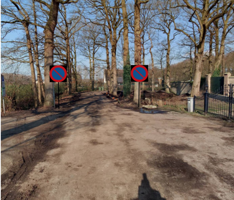
Situatieschets Kloosterlaantje, Driebergen-Rijsenburg