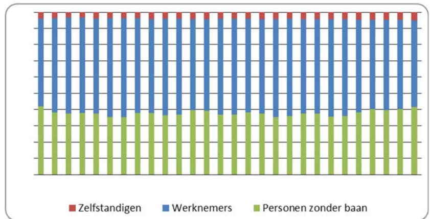
Figuur 2: Ontwikkeling in aandeel werknemers, zelfstandigen en personen zonder baan; EU 26 (CBS).