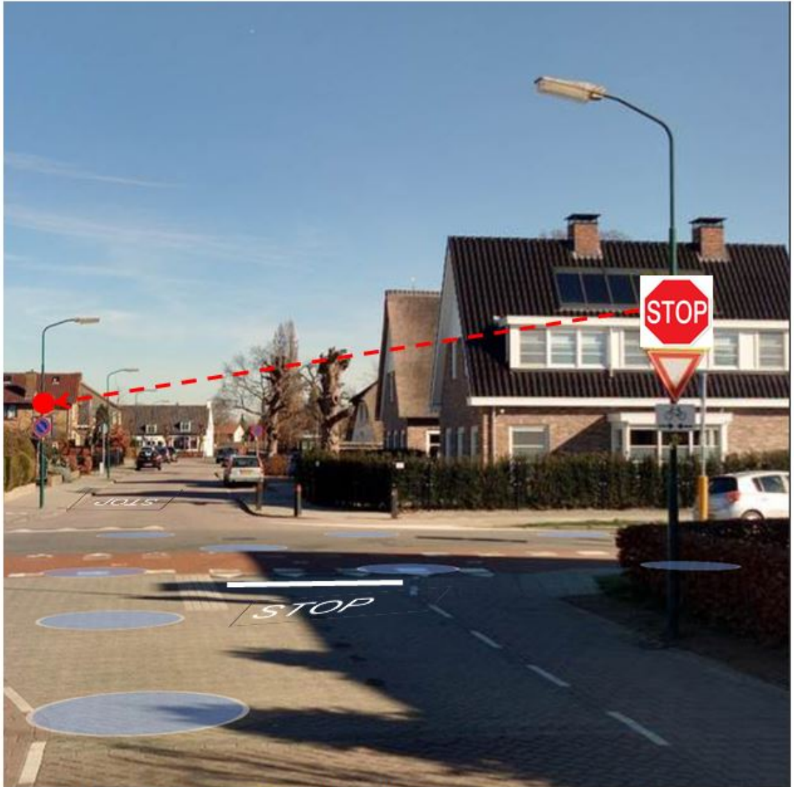
Figuur 2 straatbeeld met de beoogde positie stopbord en wegmarkering stopstreep