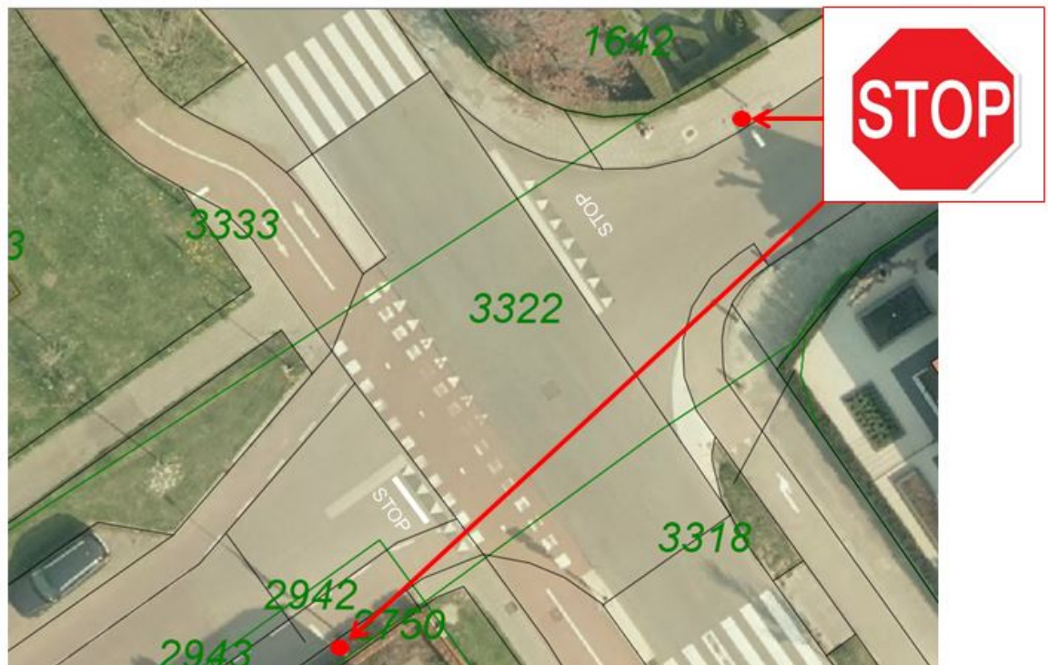
Figuur 1 de locaties van het stopbord en wegmarkering stopstreep aangeduid