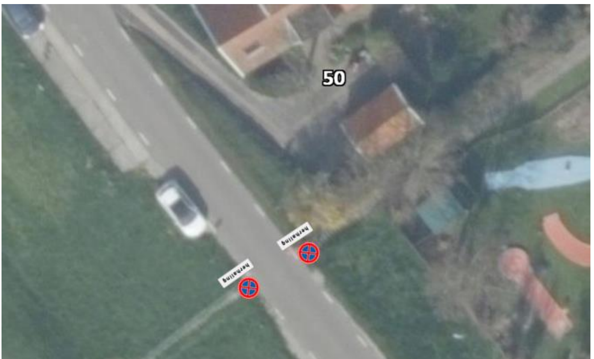
Figuur 2 Plaatsing herhalingsborden onder bestaande E02 nabij nr. 50.