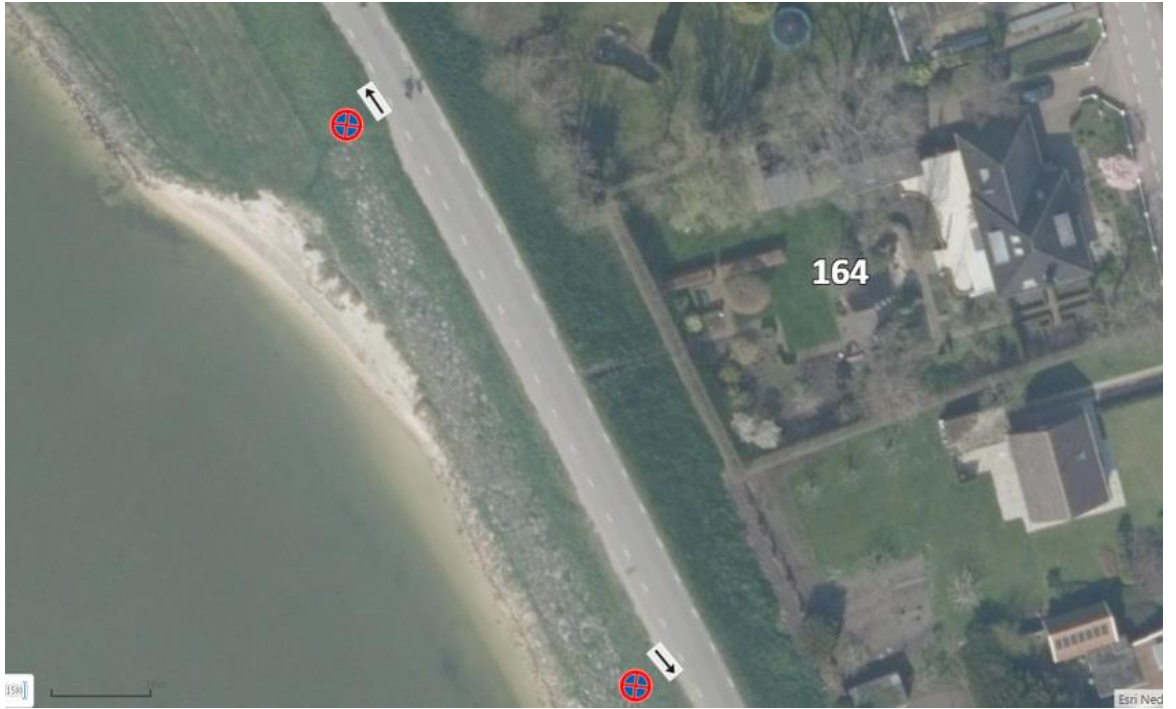
Figuur 3 Plaatsing E02 met OB501 parallel aan de weg aan weerszijden van de verbreding nabij nr. 164.