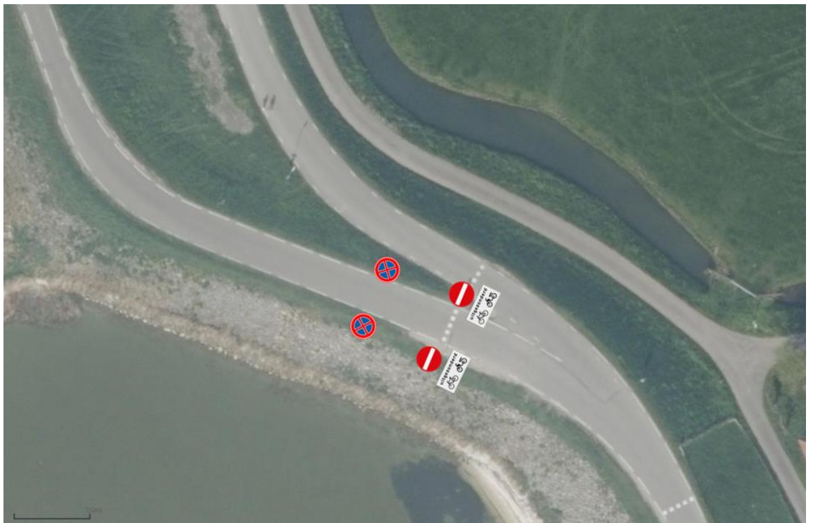
Figuur 4 Plaatsing E02 nabij Y-splitsing Zuiderdijk Dorpsweg.