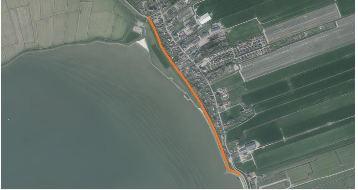
Figuur 5 Het stopverbod geldt voor het gehele wegvak 10096/220 vanaf De Laan tot de Y-splitsing ten zuiden daarvan (zie oranje lijn), met uitzondering van de wegverbreding bij Dorpsweg 164, zoals is weergegeven in figuur 3.