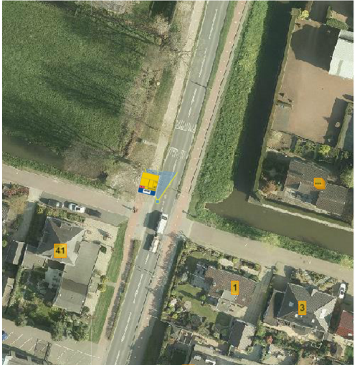
Afbeelding 2: omgeving halte Windmolen

Op de Edisonlaan, ter hoogte van de Korenmolen, leggen we aan de centrumzijde van Bleiswijk een halte aan. Deze plek is gekozen, omdat deze locatie een goede dekking biedt voor de inwoners en bezoekers in het noordoosten van Bleiswijk. De overzichtskaart (afbeelding 1) toont dat deze haltes het dichtst bij de Molenwijk ligt. We leggen deze halte op deze plek aan, zodat deze niet direct voor een woning ligt. Daarnaast ligt de halte vlak na een drempel, wat een positieve invloed heeft op het verkeer dat achter de bus rijdt. Door de drempel minderen auto's vaart. Als de bus stopt op de halte kunnen auto's daardoor makkelijker stoppen.