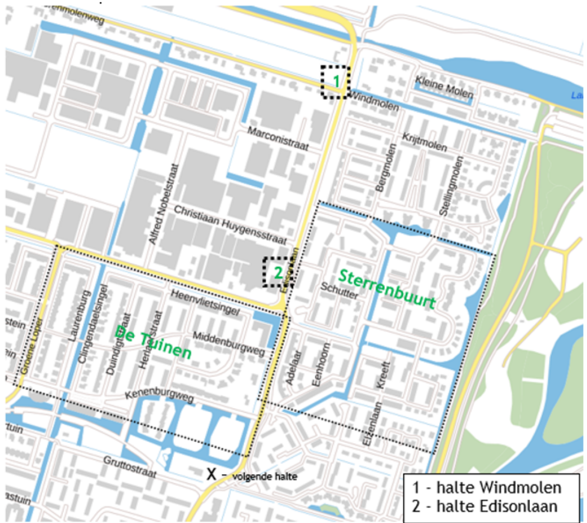
Afbeelding 1: overzichtskaart haltes Windmolen en Edisonlaan

We hebben de nieuwe haltes zodanig gespreid, zodat zoveel mogelijk mensen gebruik kunnen maken van het openbaar vervoer,