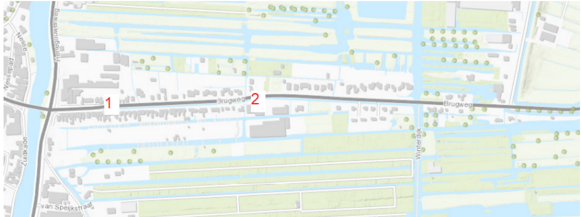
Figuur 1: locaties bord maximumsnelheid 30 Brugweg