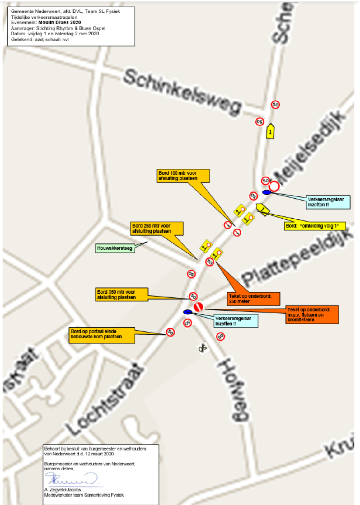
DETAILBIJLAGE 2 Moulin Blues Festival 2020