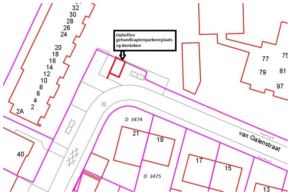
Foto situatie Van Galenstraat