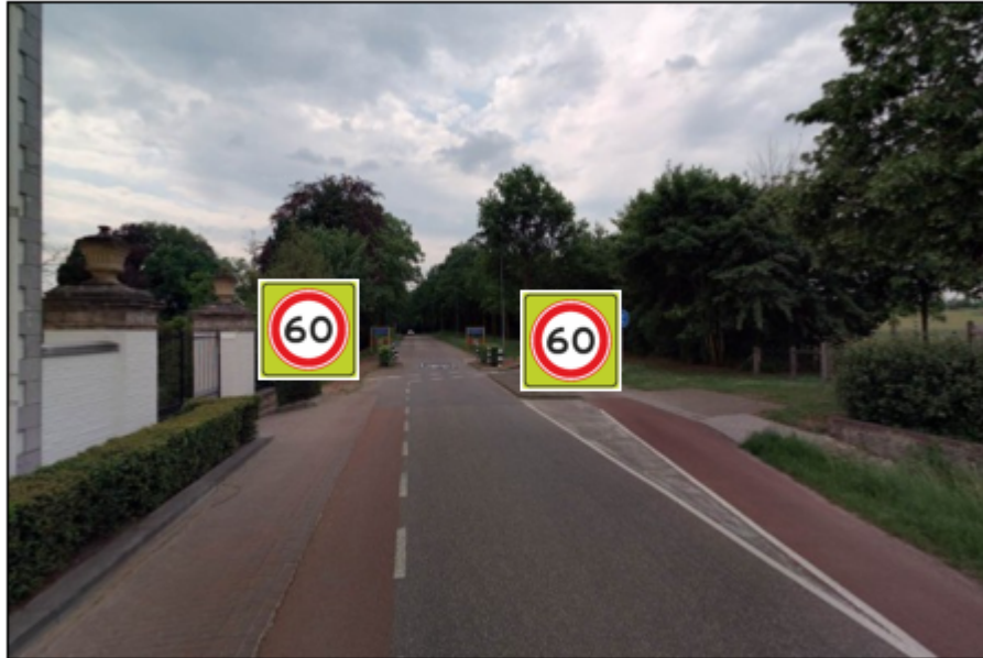
Komgrens Ulestraten A0160fs monteren in komportaal