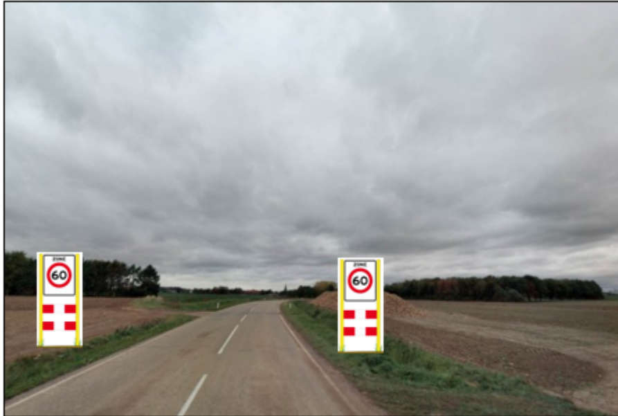
Gemeentegrens, zoneportaal 60 km/uur