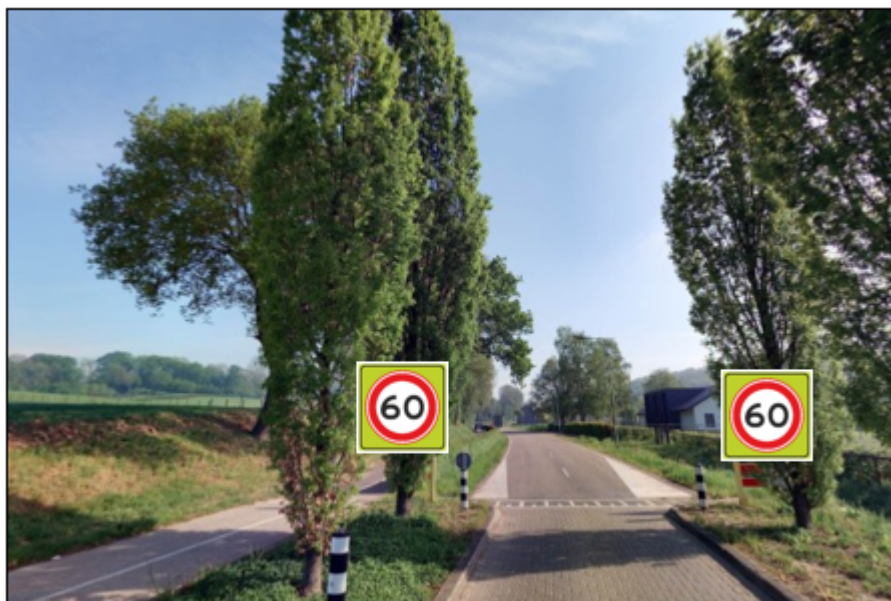
Komgrens Meerssen A0160fs monteren in komportaal