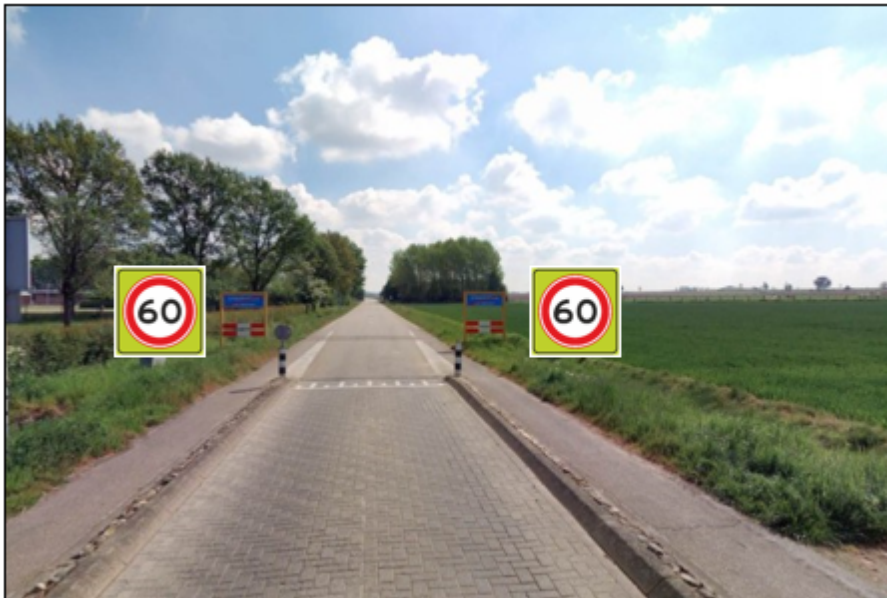
Komgrens Ulestraten-A0160fs monteren in komportaal