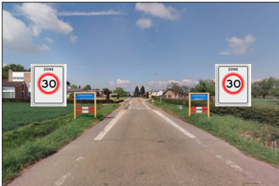
Komgrens Ulestraten, Pastoor van Eijsstraat A0130fs monteren in komportaal