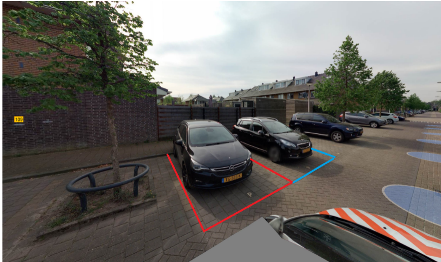
Afbeelding 1. Locatie parkeergelegenheid voor het opladen van elektrische voertuigen aan de Dadelgaarde.

(Rode markering= Besluit punt 1: Nu te realiseren parkeervak voor opladen elektrische voertuigen.